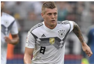
Kroos, en un partido con Alemania

El centrocampista de la selección alemana y del Real Madrid participó en una charla en la que planteó las condiciones de los trabajadores del evento, aunque descartó un boicot.